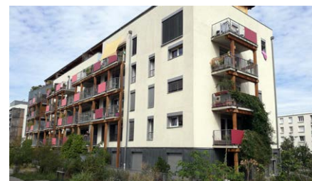
Le Village Vertical, Villeurbanne

À l'échelle de l'immeuble s'organisent la gestion des déchets, la récupération des eaux de pluie, l'autopartage... Les habitants se groupent pour acheter ensemble des produits bio ou de l'électricité d'origine renouvelable.